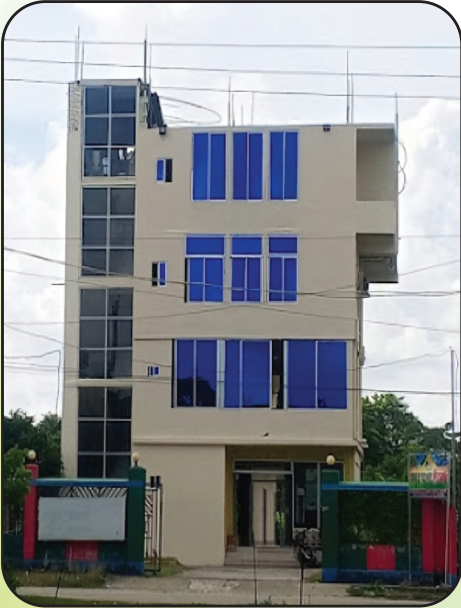
বর্তমান হোটেলের ছবি

বর্ধিত কাজ শেষে হোটেল সম্পূর্ণ হবে ২০২৮ সালে। তখন আজকের চেয়ে লভ্যাংশ বেশি হবে। ২৩টি রুমের চেয়ে ১০৩টি রুমের ইনকাম ও লভ্যাংশ অবশ্যই বেশি হবে।