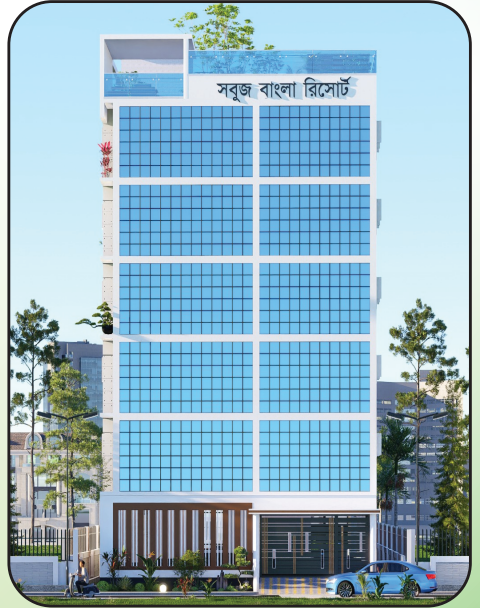
প্রজেক্ট হোটেলের ছবি